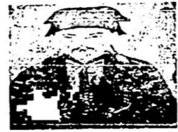
图 5 郑成功

材料四（清朝前期）外国商人入境中国受到严格限制。与中国的通商是季节性的，仅限于广州一地，且管制甚严。他们不得进入中国内地，种种规章制度专为限制他们的活动范围而定。