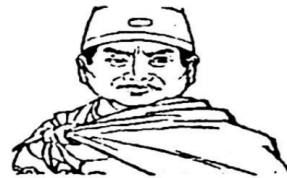
图 3 郑和