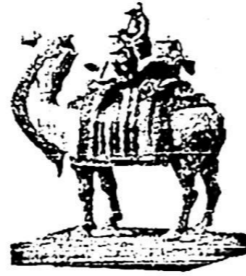
图 2 唐三彩骑骆驼乐舞俑

汉唐骆驼形象变化的轨迹，表现出中外交往的不断深入。汉代关于骆驼的艺术形象较少，骆驼蹄子与马蹄无异，形象塑造与真实的骆驼存在差距，唐代胡人牵引载货骆驼如同是天经地义的造型选择，骆驼形象塑造越多、制作更为生动，显然是在向往、猎奇后的创作。骆驼作为一种符号，象征着当时“丝绸之路”的兴盛。