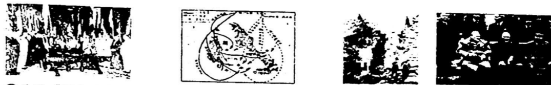
① 签署《联合国宣言》 ② 日本偷袭珍珠港示意图 ③ 苏军攻克柏林 ④ 雅尔塔会议