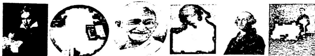
① 贝多芬 ② 但丁 ③ 甘地 ④ 瓦特 ⑤ 华盛顿 ⑥ 爱迪生